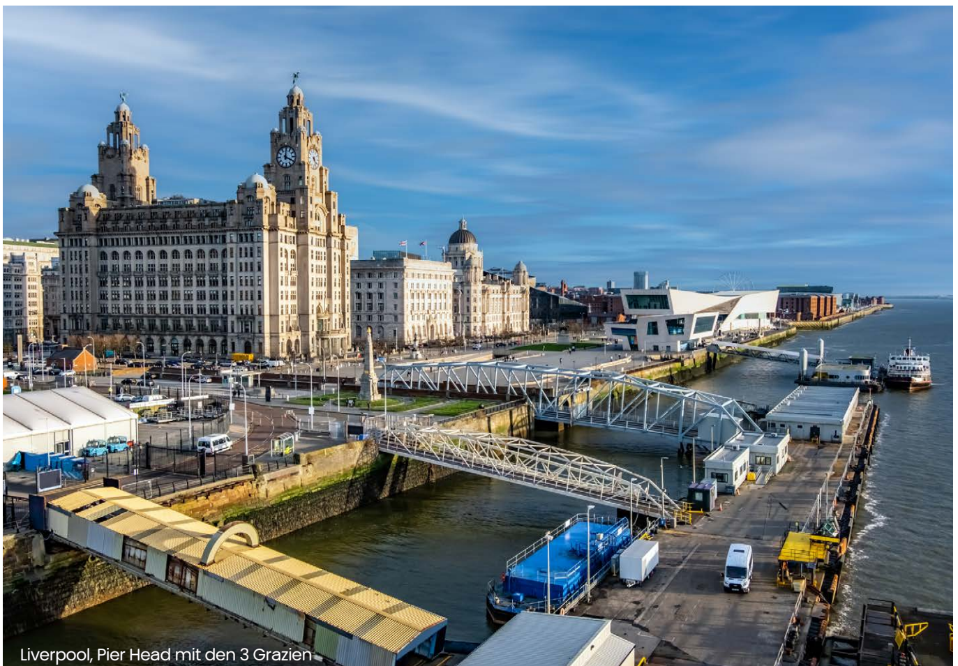
Liverpool, Pier Head mit den 3 Grazien

Hinweis: Ein Teil der ursprünglich im Wachstumschancengesetz verankerten Maßnahmen wurde bereits 2023 mit einem gesonderten Gesetzge-