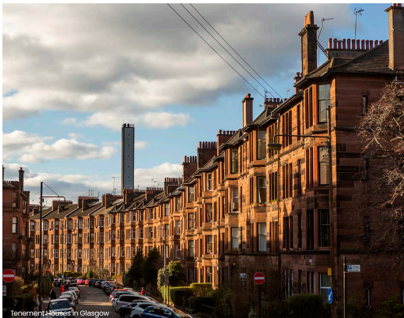
Tenement Houses in Glasgow

Aufgrund der Gesamtverantwortung obliegen dem nicht zuständigen Geschäftsführer allerdings Überwachungspflichten, deren Verletzung eine Haftung begründen kann. Er ist zum Eingreifen verpflichtet, wenn Anhaltspunkte dafür bestehen, dass der zuständige Geschäftsführer seine Aufgaben nicht ordnungsgemäß erfüllt. Im Urteilsfall waren hierzu keine Feststellungen getroffen worden, weswegen die Sache an die Vorinstanz zurückverwiesen wurde.