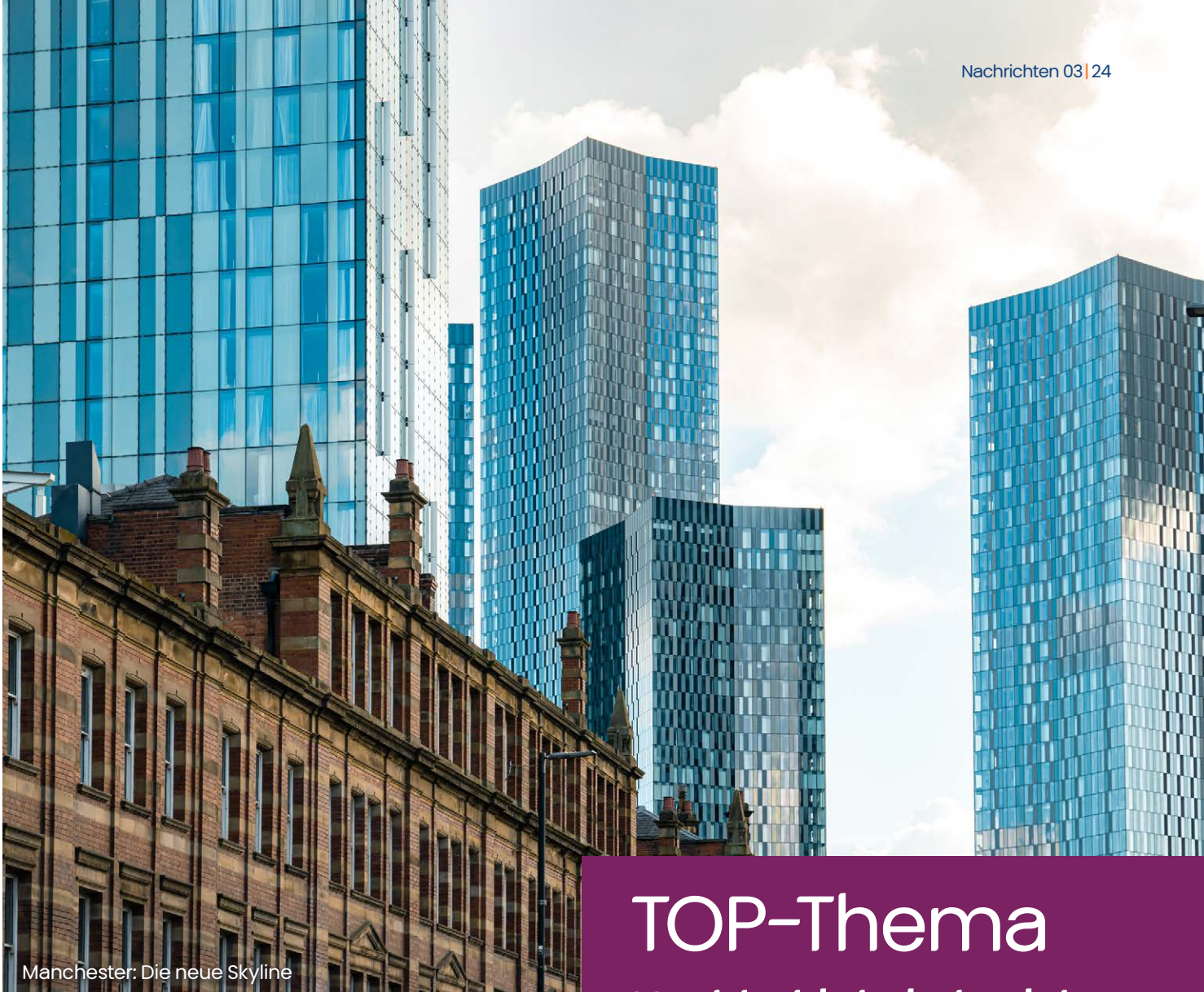
Manchester: Die neue Skyline

Titelfoto: Portree, Isle of Skye, Schottland