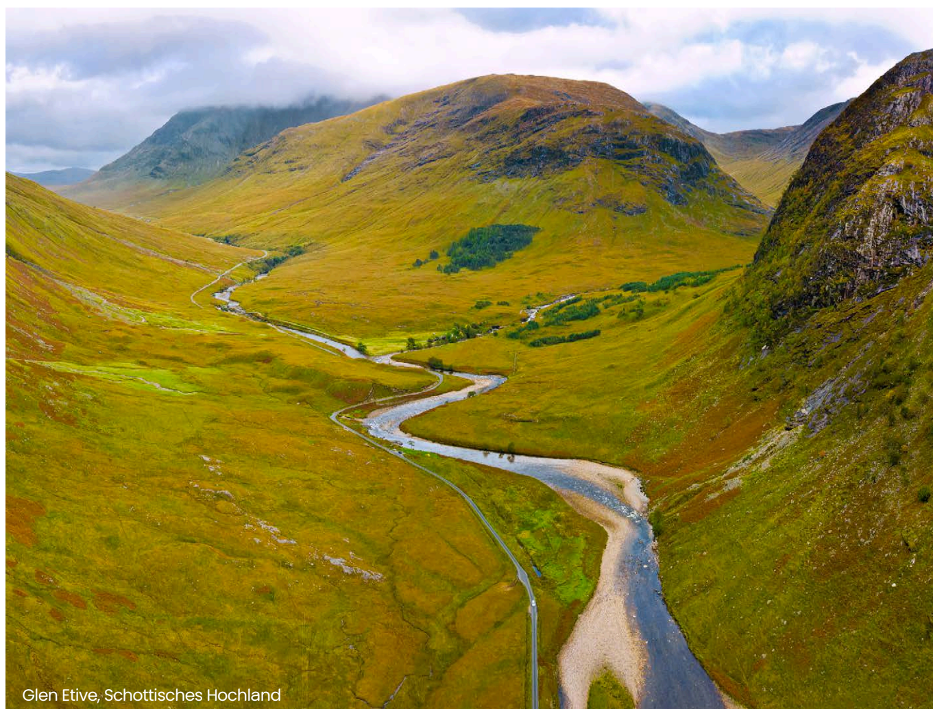
Glen Etive, Schottisches Hochland

Die maßgebliche Frage aus datenschutzrechtlicher Perspektive ist, inwiefern bei der Verwendung von KI personenbezogene Daten genutzt werden dürfen. Sofern der Arbeitnehmer in textbasierte Dialogsysteme personenbezogene Daten i.S. von Art. 4 Nr. 1 der DSGVO eingibt, kann dieses datenschutzrechtliche Problem durch eine Einwilligung des Betroffenen in den Verarbeitungsprozess gem. Art. 5 Abs. 1 Buchst. a der DSGVO gelöst werden. Hierfür ist jedoch die Kennt-