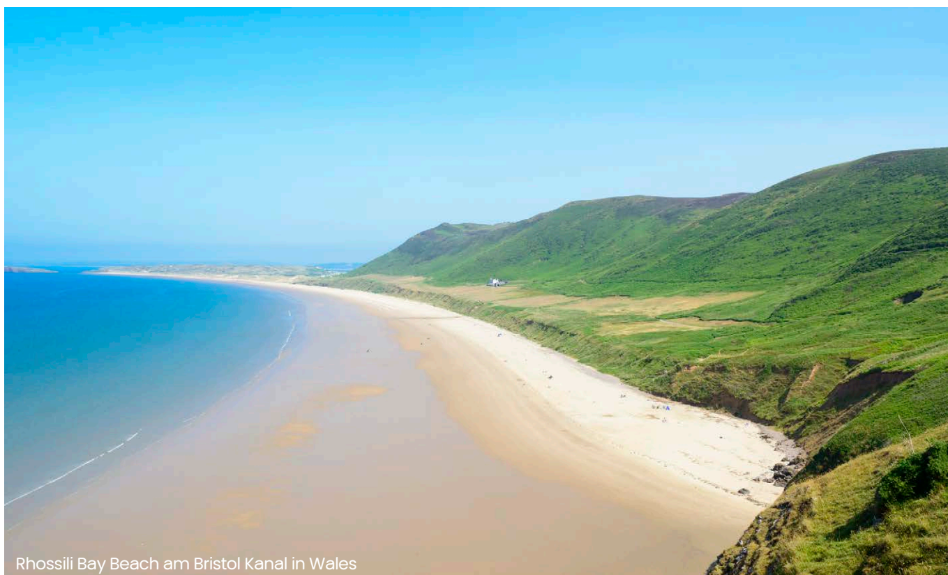
Rhossili Bay Beach am Bristol Kanal in Wales

„Verträge hier kündigen“ oder mit einer anderen entsprechend eindeutigen Formulierung betitelt sein. Die fehlende gute Lesbarkeit resultierte im vorliegenden Fall daraus, dass der Button mit der Aufschrift „Kündigen“ kleiner geschrieben war als der restliche Fließtext auf der Website. Außerdem müssen nach