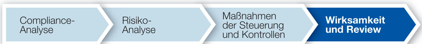
Abb. 5: Abschlussphase: Überprüfung der Wirksamkeit und Review