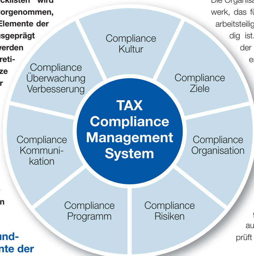
Abb. 2: Grundelemente der Tax Compliance

Das Tax-Compliance-Programm beschreibt die Grundsätze und Maßnahmen, die den Risiken entgegenwirken sollen, sowie die Maßnahmen,