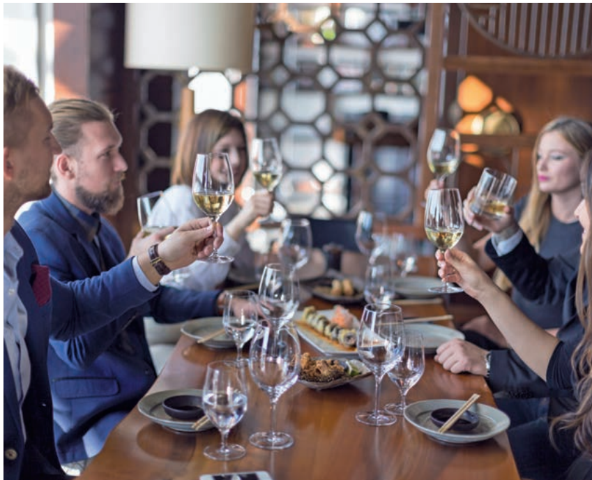
Betriebsfeiern sind oft mit steuerlichen Risiken verbunden

Reisekosten (Fahrkosten, Verpflegungsmehraufwand, Übernachtungs-