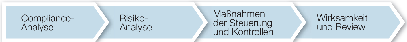
Abb. 1: Vier Phasen des PKF Tax Compliance Management Systems

ance systematisch die steuerlichen Risiken identifiziert und bewertet werden. Anschließend können die Standard- oder weitere spezielle Module einzeln beauftragt werden. Unterstützend kommt das „PKF Tax CMS Tool“ zum Einsatz, das auf Excel basiert und außerhalb des ERP angewendet werden kann. Über das „PKF Tax CMS Tool“ werden die vier nachfolgend im Überblick skizzierten Prozessphasen (vgl. Abb. 1) gesteuert und dokumentiert.