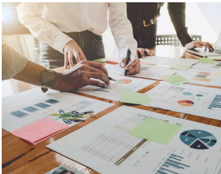
Qualitätsprüfung der umsatzsteuerlichen Datenaufzeichnungen und Meldungen

Entscheidend für den Erfolg des Compliance-Programms ist, dass die Mitarbeiter der Steuerabteilung sowie Mitarbeiter aus Abteilungen mit umsatzsteuerrelevanten Aufgabefeldern über die erforderlichen Kenntnisse der Umsatzsteuer verfügen. Die Prozesse zur Einhaltung der gesetzlichen Vorgaben sind unter Einbezug bereits bestehender Kontrollen zu dokumentieren. Dabei sind auch die Prozesse der angrenzenden Unternehmensbereiche (wie Logistik oder Vertrieb) einzubeziehen. Es ist sicherzustellen, dass die zuständigen Mitarbeiter hinreichendes Wissen im steuerlichen Bereich besitzen, um potentielle Risiken identifizieren und kommunizieren zu können. Die Steuerabteilung sollte mit ausreichend Personal ausgestattet sein, um dem Risiko entgegenzutreten, dass elementare Aufgaben wie die Abgabe von Voranmeldungen und Jahreserklärungen nicht fristgerecht durchgeführt werden können.